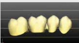
Positionierung im unteren Drittel der Ronde.

Zu den multicolor Ronden bietet pritudenta® eine Softwareapplikation an. Das ermöglicht eine gezielte Farbeinstellung der Restauration in den Rohlingen.