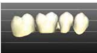
Positionierung im oberen Drittel der Ronde.