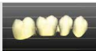
Positionierung im mittleren Drittel der Ronde.